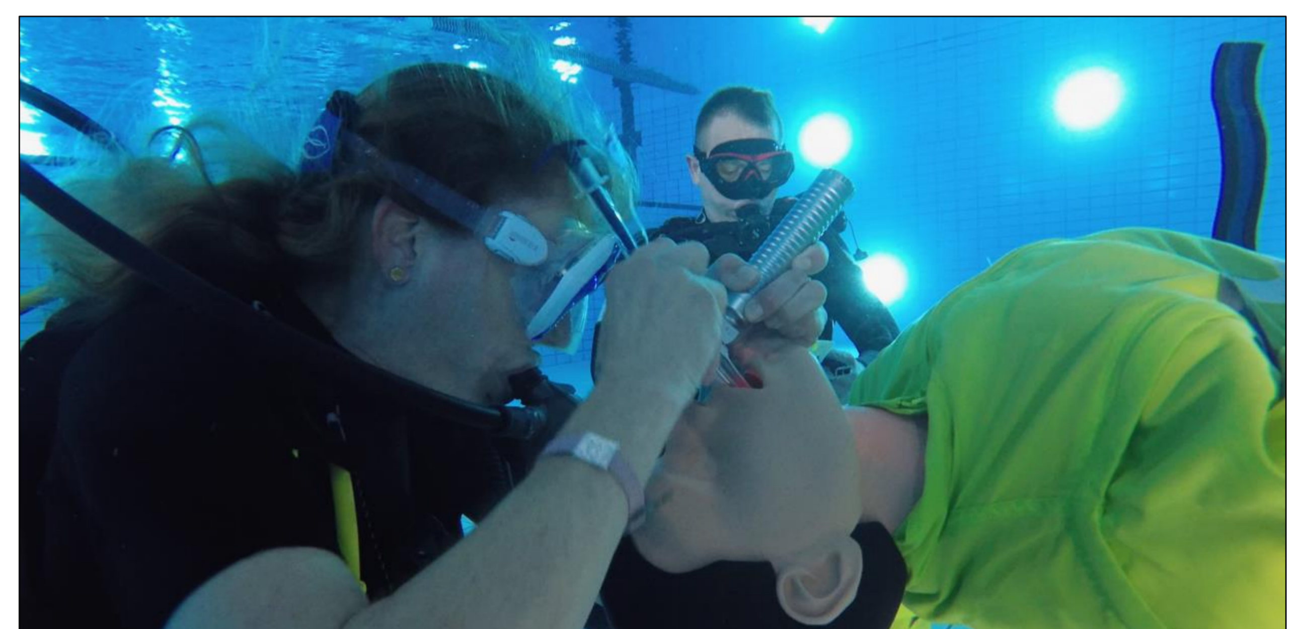
Abb. 2/3 – Versuchsaufbau mit Unterwassermodell